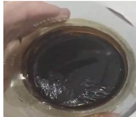
Gambar 1. Ekstrak Kental Daun Namnam

Hasil rendemen dari tahap ini diperoleh sebanyak 11,2%. Nilai rendemen ini diperoleh dari massa ekstrak kasar dibagi dengan massa simplisia yang digunakan. Daun namnam yang dikeringkan dari 400 g menjadi simplisia 100 g. Ekstrak kental ini berwarna coklat pekat dan berikut adalah tampilanya.