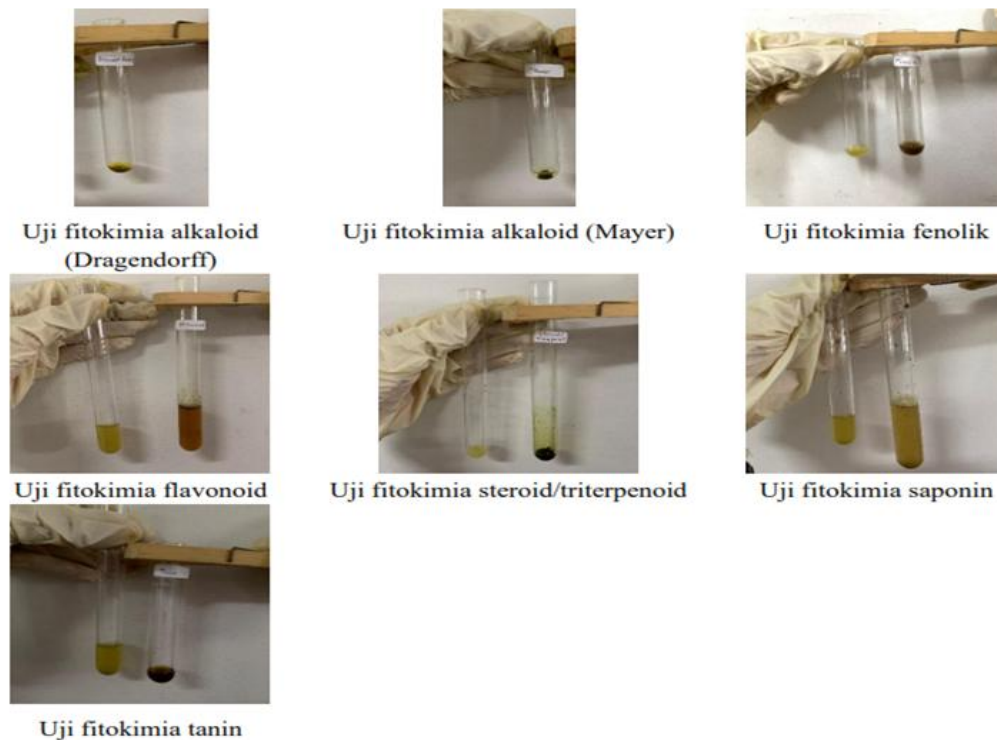
Gambar 2. Hasil Uji Fitokimia Ekstrak Daun Namnam

Tahapan berikutnya dilakukan uji fitokimia untuk mengetahui kandungan zat aktif pada ekstrak tersebut. Berikut adalah hasil uji fitokimia sebagai berikut :